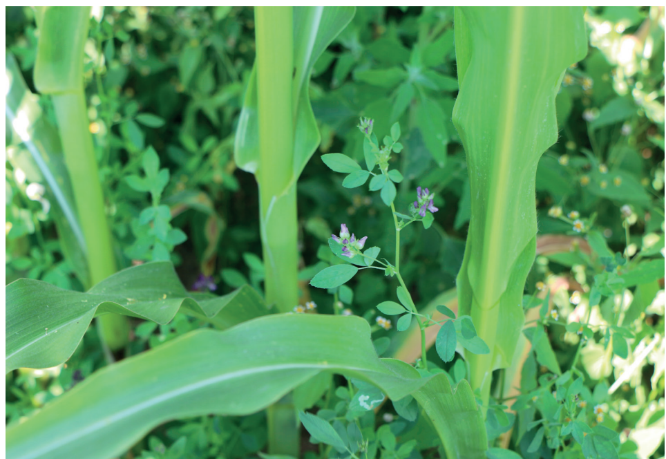
Bild 3: Luzerne blühte 2 Wochen vor dem Mais